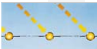
Painel tradicional alumínio / cobre

A utilização dos painéis selectivo na Série "K" da Solahart melhorou o desempenho do "circuito fechado" tornando-o um dos sistemas mais eficazes de aproveitamento de energia solar para o aquecimento de água.